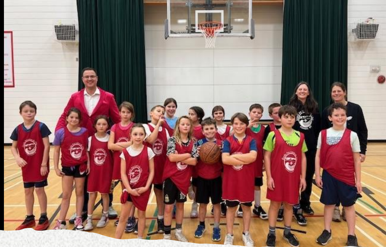
L'équipe de basketball 4e-5e