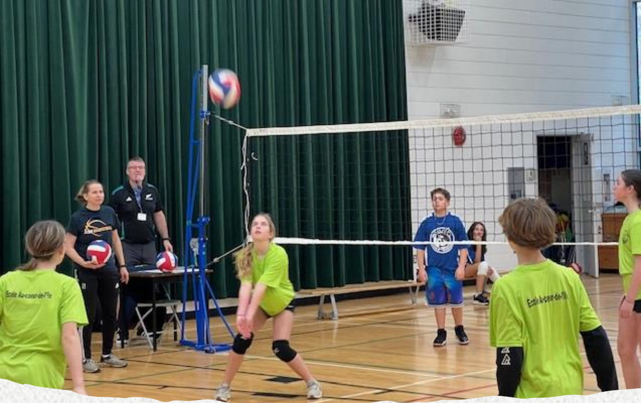
Les 7e en action au tournoi de volleyball du CSF qui a eu lieu à notre école le 18 novembre dernier.